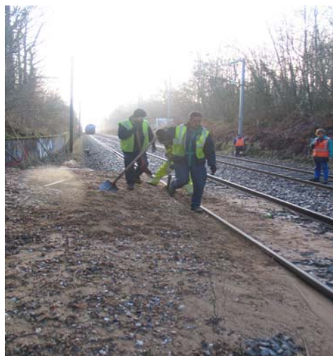
14 janvier 2009. Travaux de déblaiement de la voie par les équipes de la SNCF

La Direction régionale des travaux de la SNCF à Versailles a été alertée de cette situation, et mise en demeure de nous confirmer le lancement en urgence de la réparation du pont.