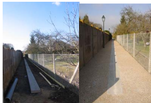
Rénovation de la sente

procéder par tranches successives, pour ne pas déséquilibrer notre budget.